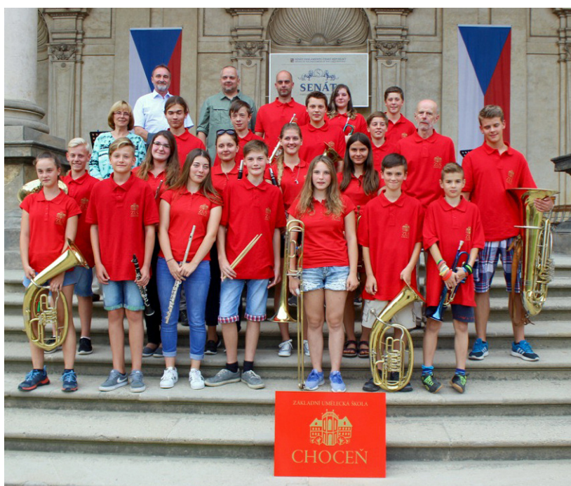
Dechový orchestr Základní umělecké školy Choceň po úspěšném vystoupení v sala terreně.