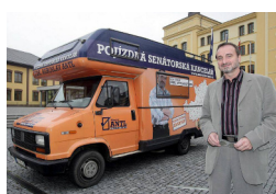
S legendární Pojízdnou senátorskou kanceláří zvanou Antlon před prvními volbami v roce 2008. Příští rok oslaví Antlon kulaté 30. narozeniny! Jak ten čas letí!

jak už nemůžu hrát basketbal, tak musím nacházet dobré radostné optimisticky myslící lidi, abych si odpočinul. A v Orlických horách a vlastně v celém mém regionu, jak v Pardubickém kraji, tak v tom Královéhradeckém, je jich pořád dost.