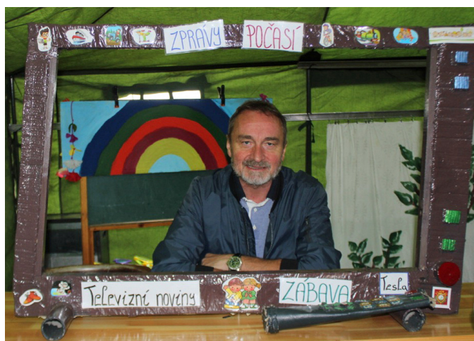
V televizi při návštěvě hasičského tábora v Záhornici :-)