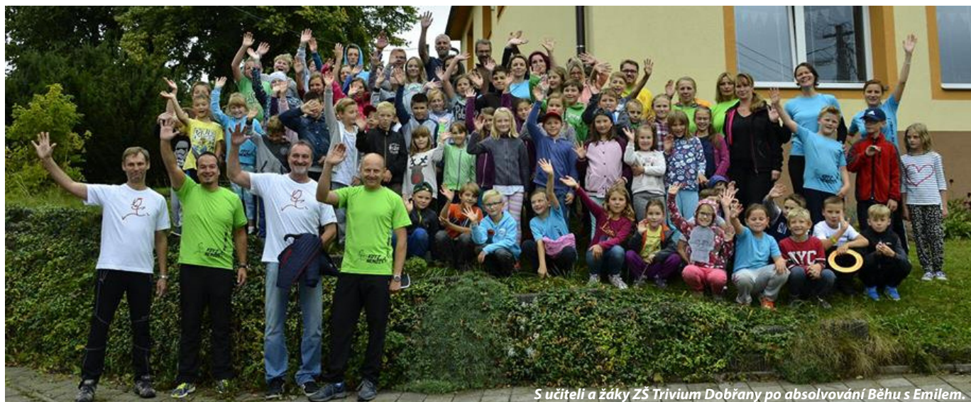
S učiteli a žáky ZŠ Trivium Dobřany po absolvování Běhu s Emilem.

Vážené čtenářky, vážení čtenáři, milí spoluobčané, vychází další číslo „Senátorského zpravodaje“, v pořadí již deváté, ve kterém se Vás snažím informovat o své činnosti v uplynulém roce. Jaký tedy byl rok 2017?