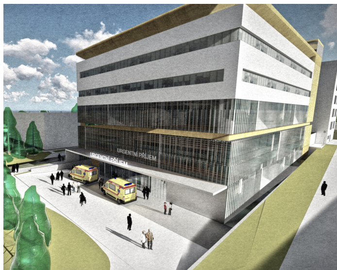
Vizualizace nové budovy pavilonu urgentního příjmu rychnovské nemocnice.

V úvodníku jsem se zmínil o aktualizaci vládního usnesení k průmyslové zóně Solnice - Kvasiny z února 2015. Došlo k němu 21. června 2017 a znamená navýšení původní investice o další 3 miliardy, celkem tedy na šest miliard korun. Nemá cenu vyjmenovávat jednotlivé akce, materiál zahrnuje asi 50 projektů, v plánu jsou například výstavby obchvatů obcí Solnice a Častolovice, stavba železniční stanice Lipovka, nové chodníky, přechody, veřejná osvětlení či kanalizace v Kvasinách a Solnici. Počítá se s výstavbou nájemních bytů v Rychnově nad Kněžnou, Solnici a okolí a samozřejmě již zmíněné posílení kapacit Policie ČR. K zlepšení bezpečnosti by měl přispět i nákup nového kamerového systému v Rychnově nebo vybudování cyklostezky na Pelclovo náměstí. Mnohé z projektů se budou realizovat již v roce 2018 a věřím, že ve svém příštím zpravodaji již budu moci uvést příklady dokončených projektů.